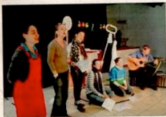
Les comédiens ont répété devant le public capelain.