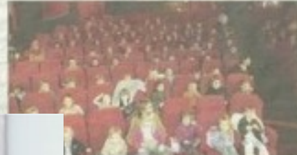
Beaucoup de bons élèves pour les enfants et leurs parents