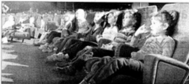
Des spectateurs imperturbables.