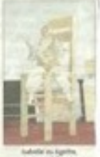
Bobo Doudou, l'ami des enfants

Le spectacle Bobo Doudou est composé de 85 000 élèves et adultes en spectacle. Bobo Doudou est un spectacle de prévention et d'éducation pour les enfants de 3 à 6 ans. Le spectacle est composé de 85 000 élèves et adultes en spectacle. Bobo Doudou est un spectacle de prévention et d'éducation pour les enfants de 3 à 6 ans.