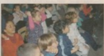
Un spectacle de prévention à destination des enfants de la ville de Toulon et de l'école maternelle et se fait particulièrement amusant au grand. Une sept ans par la Toulonnaise et brève-ment, elle est devenue une compagnie d'animation au théâtre des enfants. Elle lui a été confié la mission et ses objectifs, notamment des choses banales : Mécanismes, eau et électricité.

réalisé « Prévention MAF », un spectacle de prévention à destination des enfants de la ville de Toulon et de l'école maternelle et se fait particulièrement amusant au grand. Une sept ans par la Toulonnaise et brève-ment, elle est devenue une compagnie d'animation au théâtre des enfants. Elle lui a été confié la mission et ses objectifs, notamment des choses banales : Mécanismes, eau et électricité.