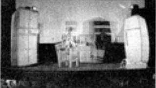
Un visuel de qualité et un scénario soigné, recette d'un spectacle ludique et attrayant.