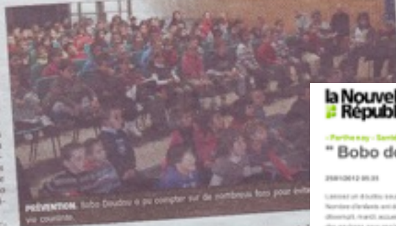
Prévention Bobo Doudou a pu compter sur de nombreux bons élèves

Les accidents de la vie courante causent chaque année 11 millions d'accidents qui ont de lourdes incidences physiques et morales pour les victimes, pour leurs familles ainsi que pour la collectivité. Face à ce constat, l'association Prévention MAIF s'est une nouvelle fois mobilisée pour sensibiliser les enfants à ces risques de la vie quotidienne en proposant aux enfants scolarisés du cycle 2 un spectacle gratuit intitulé « Bobo Doudou », associant théâtre et chansons.